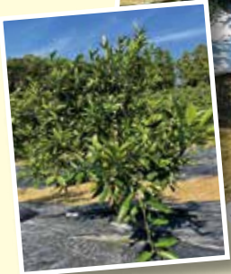
▲浩大くんの就農に 合わせて植え替えられた みかんの木