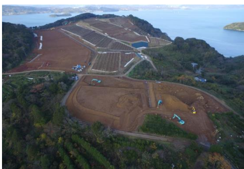
【白崎地区基盤整備 工事中：R1.12月】