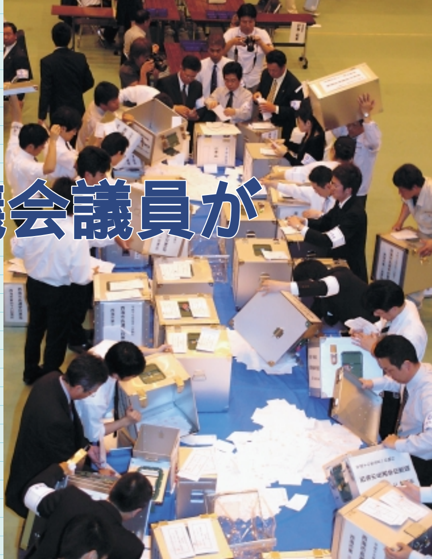
開票状況 - 西海スポーツガーデン