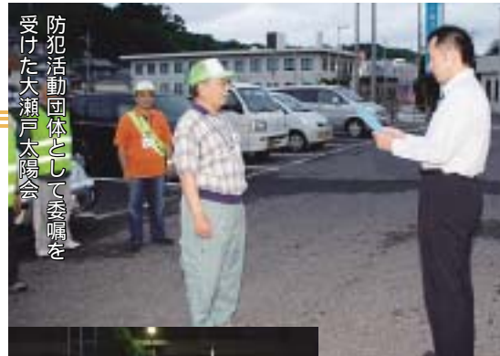
防犯活動団体として委嘱を受けた大瀬戸太陽会

出発式終了後、青色回転灯を装着した2台を先頭に、さっそく市内の防犯パトロールのため市役所前を出発しました。