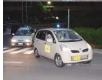
市役所前を出発する青色回転灯装着車