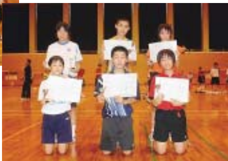
中学生の部優勝の3組