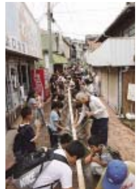
たくさんの人で賑わいました

このイベントは、西海市商工会青年部大島支部が初めて企画したもので、商店街に設けられた160メートルのそうめん流しを楽しもうと、子どもからお年寄りまで、たくさんの人で賑わいました。