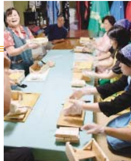
おいしそうなお寿司が出来ました

また、総会に先立ち、参加者は「大島・崎戸町探訪」「西海寿司作り」「横瀬浦さるく」の3つのコースで西海市内のグリーン・ツーリズムを体験しました。