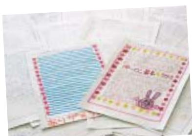
鹿児島市立甲東中学校から届いた感想文