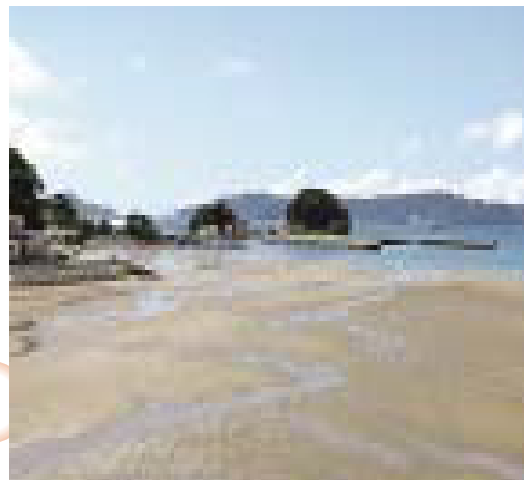
柳の浜海水浴場 (大瀬戸)