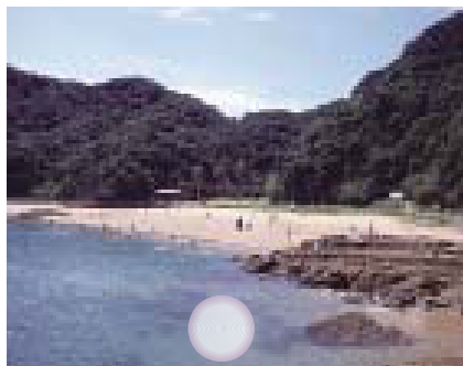
大釜海水浴場 (大島)