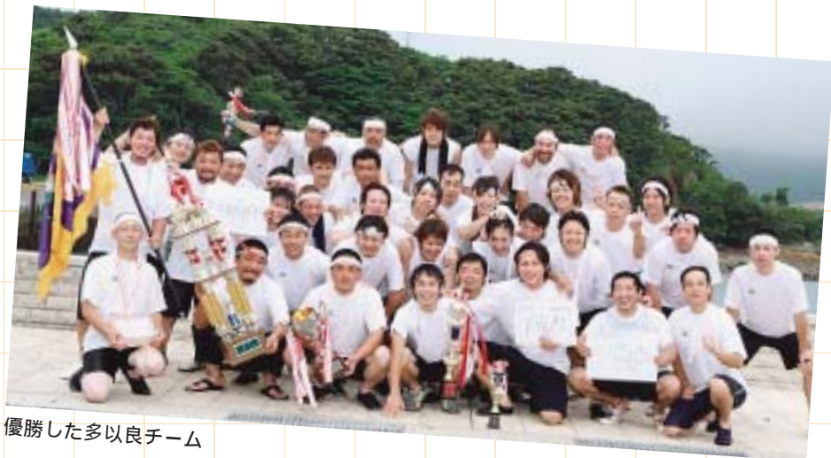
優勝した多以良チーム

西海市となって3回目の大会は、市内や近隣町から多くの見物客が詰めかけて盛大に開催されました。