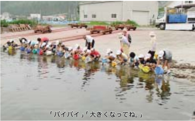
「バイバイ」「大きくなってね。」