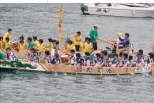
小学生体験ペーロン