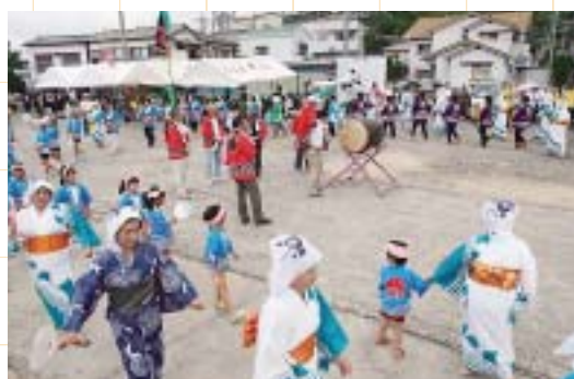
婦人会のペーロン踊り