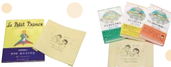
小学校「星の王子様」

「いじめ」は犯罪です。物を盗んだり、人を傷つけることと同様に、反社会的な行為です。 西海こども電話相談（月曜日～金曜日の午前9時～午後5時）☎32 - 1114