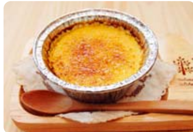
▲商品化を目指している焼き芋プリン

また、西海の歴史とかかわりのあるポルトガルのお菓子や、規格外の野菜を使った「エコベジスイーツ」も試作中です。