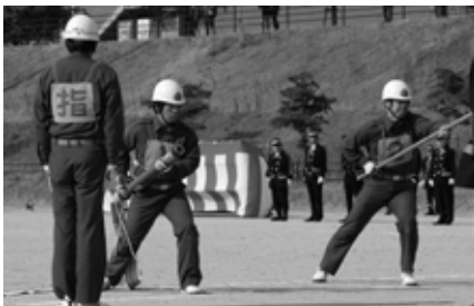
▲操法演技を行った西海方面団第6分団

最後に行われた放水演技では、防波堤に並んだ10の分団が合図と共に一斉放水を行い、新春の太田和港に水のアーチを描きました。