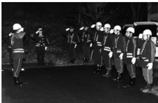
▲巡察のようす（大島方面団徳万分団）