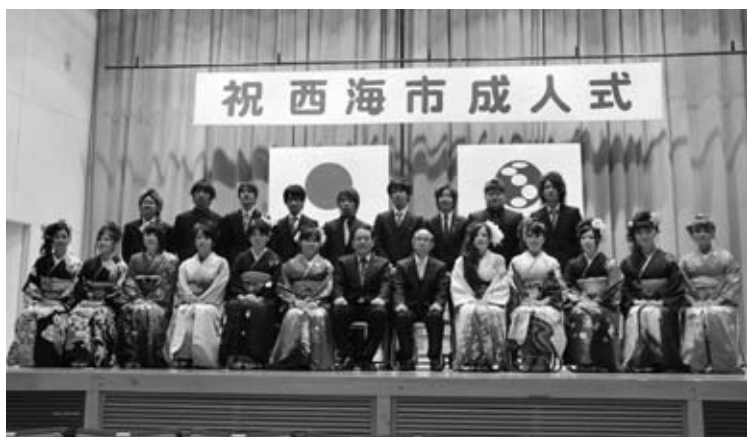
▲西海地区（西海南中校区）