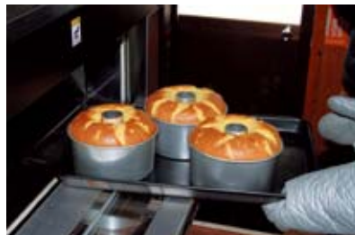
▲完成したみかんシフォンケーキ

ふわふわしっとりしてみかんの風味豊かな「みかんシフォンケーキ」は「西海のちょっとおしゃれな土産」として自慢していただけるおいしさです。みかんどームやアイスクリームショップ木場でお買い求めいただけます。