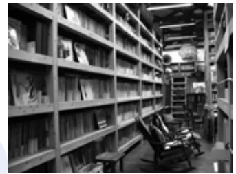
▲貴重なレコードがずらり

問い合わせ先 音浴博物館 (☎37-0222 FAX 37-0555 HPアドレス http://onyoku.org/ )