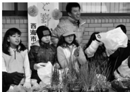
◀いらっしやいませー