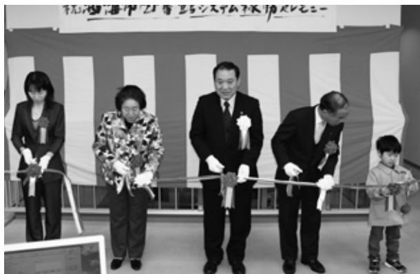
▲テープカットのようす

利用者カードと本に付いているバーコードを読み込むだけですぐに処理が終わり、貸出が完了しました。