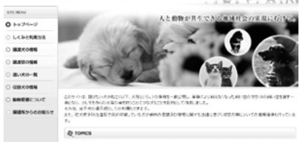
長崎県動物愛護情報ネットワーク

環境政策課では環境ニュースとしてごみ減量化や地球温暖化などの問題について情報提供・発信を行います。