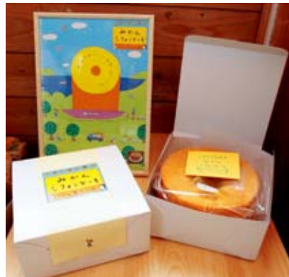
▲みかんシフォンケーキ

農家や自営業、主婦などの異業種の女性たち6名が集まり、「お母さんが安心して子どもに与えたいような素朴な手づくりお菓子」をコンセプトとして、西海市のイメージアップに繋げようと、活動に取り組んでおられます。