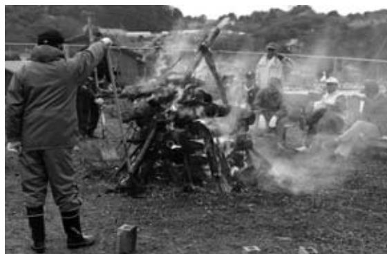
▲大瀬戸町檜浦の鬼火たき

取材に伺った檜浦地区（大瀬戸）では、竹が「パン」と弾けるたびに「おんのほね～」とかけ声がかかっていました。