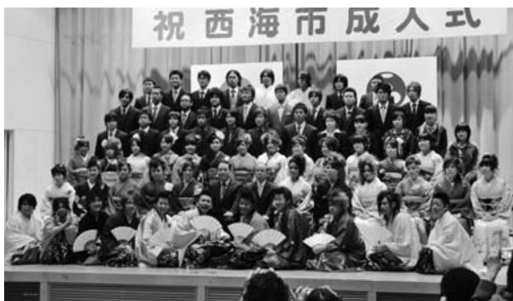
▲西海地区（西海北中校区）