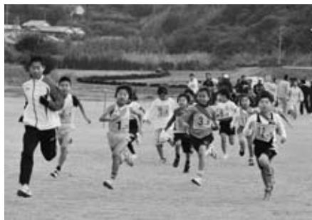
◀勢いよくスタート