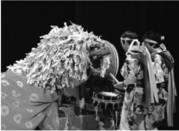
▲勇壮なさざんか会の獅子舞演舞