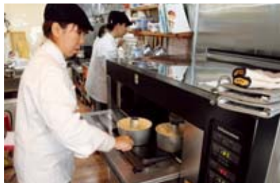
▲生地を型に入れオープンへ

地元のみかんと新鮮な地卵を使った「みかんシフォンケーキ」は何度も試作を重ね、テスト販売で好評を得て、昨年10月から本格的な量産体制に入っています。今年1月には第41回長崎県特産品新作展において、奨励賞を受賞しました。