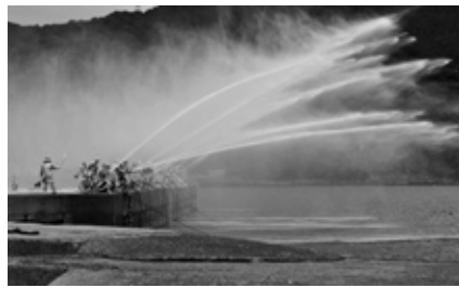
▲白いアーチを描く一斉放水