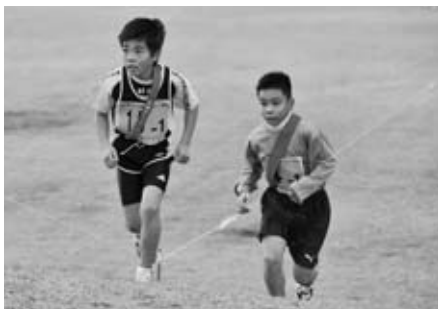
◀丘をかけたのぼる選手たち