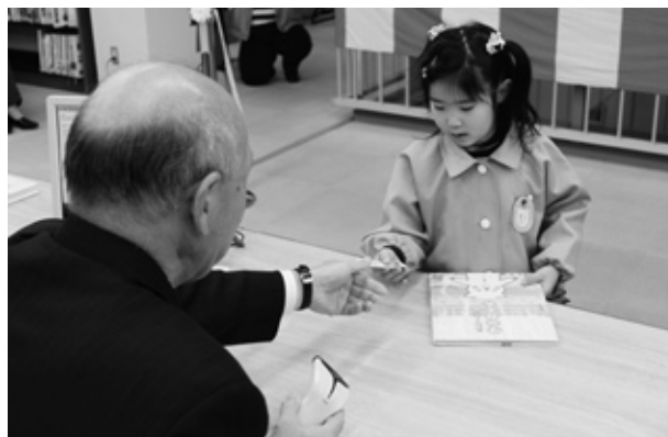
▲システム稼働最初のお客さん