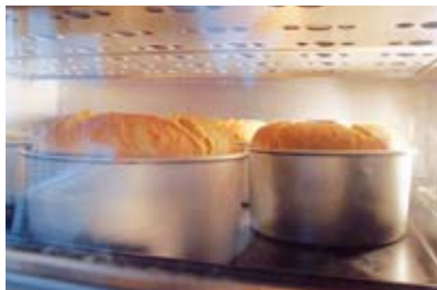
▲30分じっくりと焼き上げます