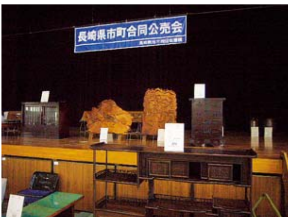
▲長崎県市町合同公売会のようす