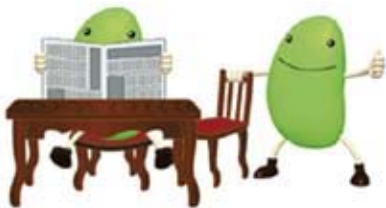
長く使えるものを選びましょう。