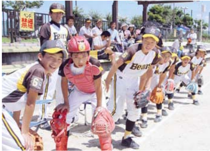
▲試合直前、整列する瀬戸ベアーズの選手たち

8月28・29日の2日間、時津町ときつ海と緑の運動公園で「第38回長崎県少年ソフトボール大会」が、開催されました。大会には各地区予選を勝ち抜いた19チームが参加し、西海市からは瀬戸ベアーズが出場。1回戦、2回戦と勝ち進み、準決勝で佐世保市代表の日野ファイターズ（今大会優勝）と対戦し、6対0で破れたものの見事第3位に輝きました。