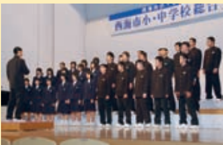
▲昨年の中学生の部

小・中学生の文化活動の振興・発展を目的として開催している西海市小・中学校総合文化祭を、今年度も昨年度に引き続き「広げよう 西海の文化を 未来へ」をテーマとして開催します。