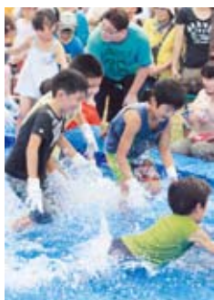
▲大物を狙ってダイブ!