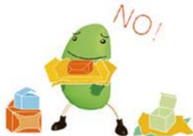
包装はできるだけ少ないものを選びましょう。