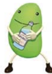
容器は再使用できるものを選びましょう。