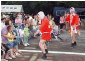
▶横瀬あっぱよし夏祭り