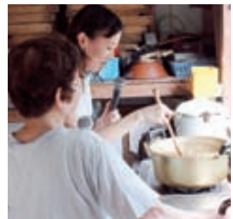
▲ところん作り名人に作り方を教わりました。