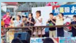
▲ラムネの早飲みにもつどもたち