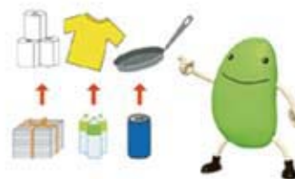
再生品を選びましょう。