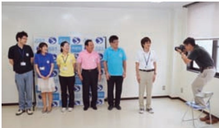
▲市役所でもクールビズに取り組みました。(写真は取材を受けているようす。中央ピンクのポロシャツが市長)

い元気村、雪浦ウィーク、松島桜坂まつりなどの先進的な取り組みのノウハウを活かして、グリーン・ツーリズムの推進拠点化を進めます。さらに大島・崎戸エリアでは、大規模事業者や県との連携による環境エネルギー導入の調査・研究を推進します。この3つのエリアの強みを活かしながら、産業の活性化と里山保全が共存し循環する仕組みを、市民の皆さんと一緒に作っていく考えです。