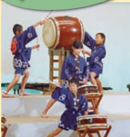
▲昨年の小学生の部