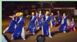
▲「踊喜連 (おどりきれん) のよさこい演舞