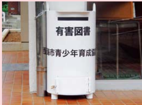
▲大島農村勤労福祉センター