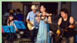
▲地元バンドのライブ演奏