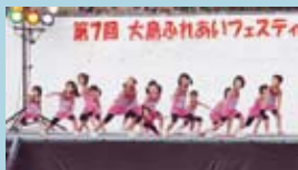
▲3B体操の子どもたち