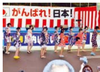
◀川内いきいき夏まつり