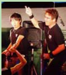
▲地元バンド「TOGOES (トゴエス)」のライブ