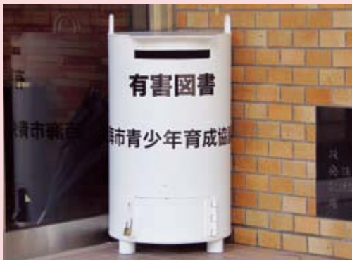
▲雪浦地区公民館（大瀬戸）