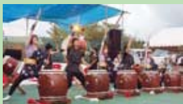
▲うず潮太鼓の演奏