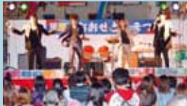
▲「NISHIXILE (ニシザイル)」のライブパフォーマンス