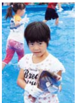
▲見事、タイをゲット!