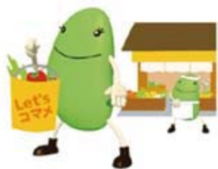
こまめに買い物袋を持ち歩きましょう。

こまめな環境配慮行動の実践を呼びかける「コマメちゃん」が行う、以下の 6 つの行動を心掛けましょう。