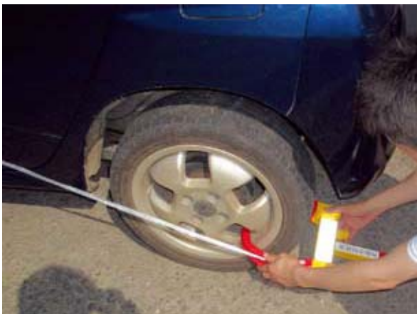
▲タイヤロックのようす

平成21年度に、長崎県地方税回収機構が設立されました。当機構は、市町村税の高額滞納案件の引き継ぎを受けて差押え・公売処分を前提に滞納整理を行う組織です。機構に引き継がれてもなお完納に至らない場合は、自動車の差押え（タイヤロック）や自宅搜索等の厳しい滞納処分が行われます。