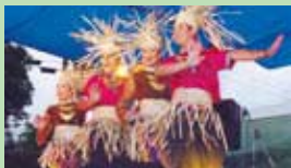
▲マレーシア民族舞踊団の華麗なる演舞