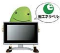
資源やエネルギーを浪費しないものを選びましょう。