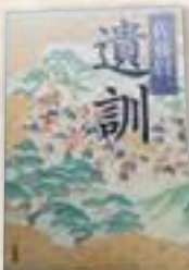
●大瀬戸地区 遺訓 佐藤 賢一

2015年。就活に惨敗した22歳の光太は、関西弁のホスト雫と出会う。雫に誘われるまま「チェペローズ」のホストとなるが、思いがけない悲劇が襲い…。十年後の世界を描いたAGE32との前後編。衝撃のラストシーンに驚愕!