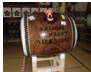
【一般コミュニティ助成事業】 八木原郷浮立保存会(西彼町) 購入品:浮立保存に必要な和太鼓、笛および衣装などの購入 事業費:約219万円 助成額:210万円