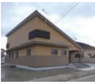
【コミュニティセンター助成事業】 板浦郷(大瀬戸町) 内容:集会施設の整備 事業費:約5,594万円 助成額:1,500万円