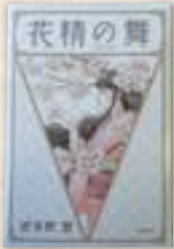
●西彼地区 花精の舞 波多野 聖

能楽家の娘として生まれた綾は、女ながら能楽師になりたいと志す。東京からロンドン、そしてパリへ。美を追い求め、舞を追い求めて、明治・大正・昭和の時代を生き抜いた女性の、華麗なる大河小説。