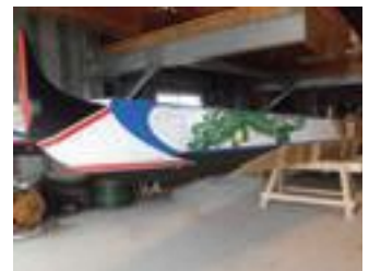
【一般コミュニティ助成事業】 大瀬戸ペーロン振興会(大瀬戸町) 購入品:ペーロン舟の整備 事業費:約232万円 助成額:230万円