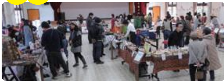
▲一番の賑わいを見せた「私の手づくりマルシェ」

感心する場面も。 その他に、アイロンがけや簡単なTシャツのたたみ方など家事に関するものや、お絵かきしたり、囲碁、将棋で対戦したり家族で楽しめるブースなども置かれ、また、3階では「私の手づくりマルシェ」として市内外から17の店舗が出店。手づくり雑貨やお菓子やコーヒーなどの販売、マッサージなどのリラクゼーション体験などがあり、最終的に100組242名の来場者で、大盛況のイベントとなりました。