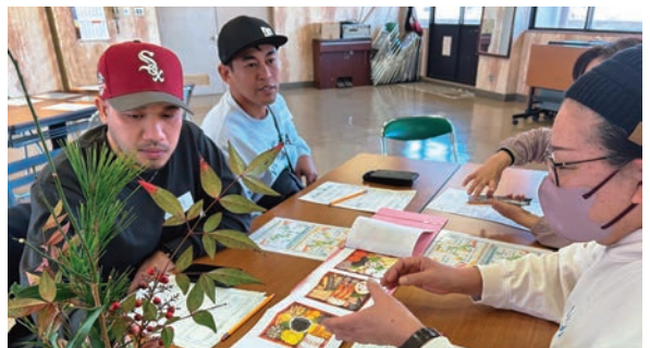
▲1月は「お正月の過ごし方」のテーマで交流しました

広報さいかいでは、おたよりを募集しています。広報さいかいの感想やちょっとした聞いてほしい小話などをお寄せください。送ってくださった方の中から抽選で、市内飲食店のお食事券をプレゼント！詳しくは裏表紙をご覧ください。