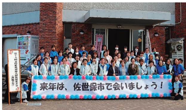
▲西海市地域婦人会の皆さん