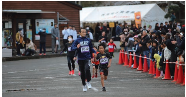
▲親子で 1 km コースを走るランナー