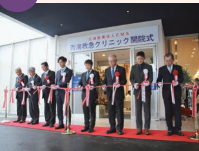
2/3 西海救急クリニック開院