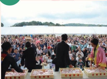
11/9 ぎゅぎゅっと！西海フェス 2025 に 約 3,000 人が来場