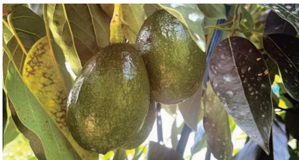
▲令和7年に実ったアボカド