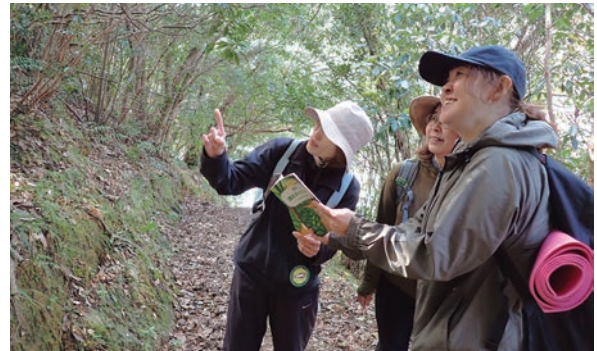
▲森の観察もウォーキングの楽しみの一つ