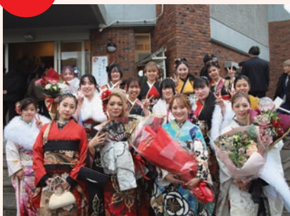
1/4 二十歳のつどいが開催され 約 170 人が出席