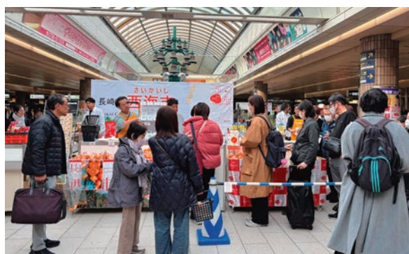
▲開店直後から多くの来場者で賑わう西海フェア

このほか、西海市自慢の焼酎やかんころ餅など多彩な特産品も並び、最終日にはほぼすべての商品が完売するという嬉しい結果となり、西海市の魅力存分にPRすることができました。