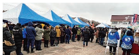
▲西海市のみかんの販売開始を待つ来場者