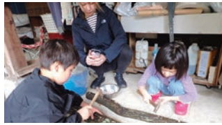
▲シイタケの種駒打ち体験の様子

森林・林業の体験を通じて、自然にふれあい、森を守り育てる大切さを学んでいます。今回は、シイタケの種駒打ちと収穫体験。人気のイベントなので、お早めにお申し込みください。