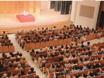
11/15 西海市市制施行 20 周年記念 「真打ち競演」公開収録