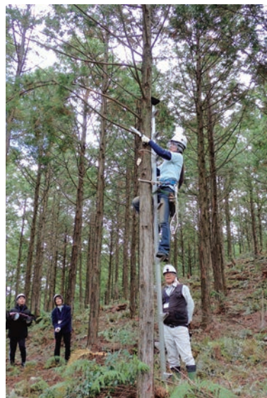
▲社員のヒノキの枝打ち作業の様子

大瀬戸町の「チューリッヒの森」で、保険会社社員や長崎大学の学生ボランティアなど約30人が参加して、ツクシシャクナゲの植林や枝打ちなどを行いました。