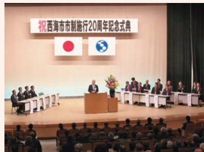
2/8 西海市市制施行 20 周年記念式典、 20 周年記念ロゴマーク表彰および記 念コンサートを開催