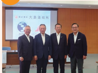
9/29 旧大島中跡地利用を検討する計画を 発表（株大島造船所、株十八親和銀行、 西海市）