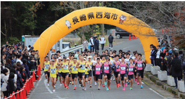
▲ 10km コースのスタートを切る高校生ランナーたち