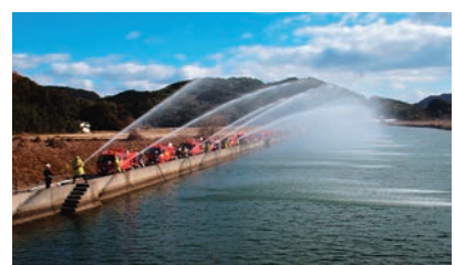
▲一斉放水（大明寺川）

式典後、西海方面団がポンプ操法を披露したほか、ラッパ鼓隊演奏による分列行進や一斉放水が行われ、地域の安全安心のために活動する消防団員の演技などに対し、観覧者から大きな拍手が送られました。