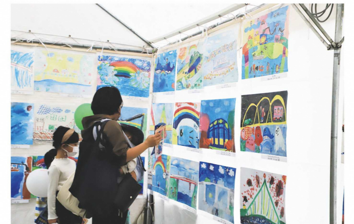
出展ブースの様子