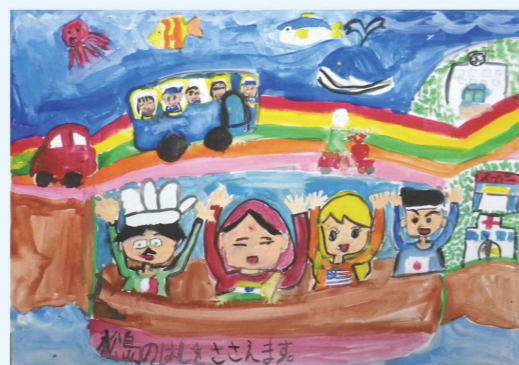
「世界みんながみまもる にじのはし」