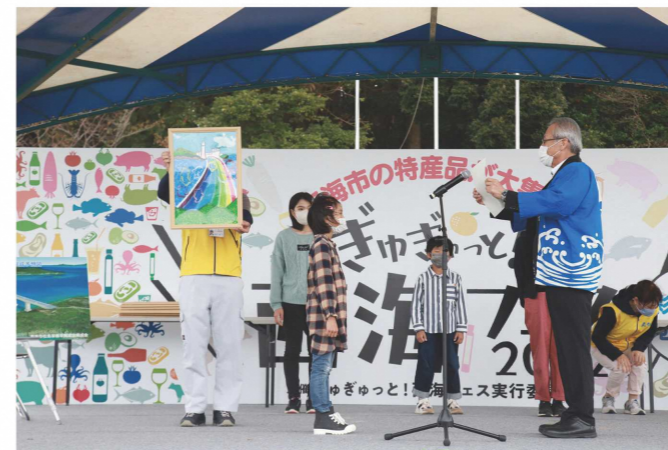
ぎゅぎゅっと西海フェス 表彰式の様子