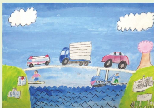
「くじらモノレールがついたはし」