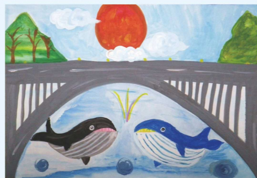
「明るい未来にかかる橋」