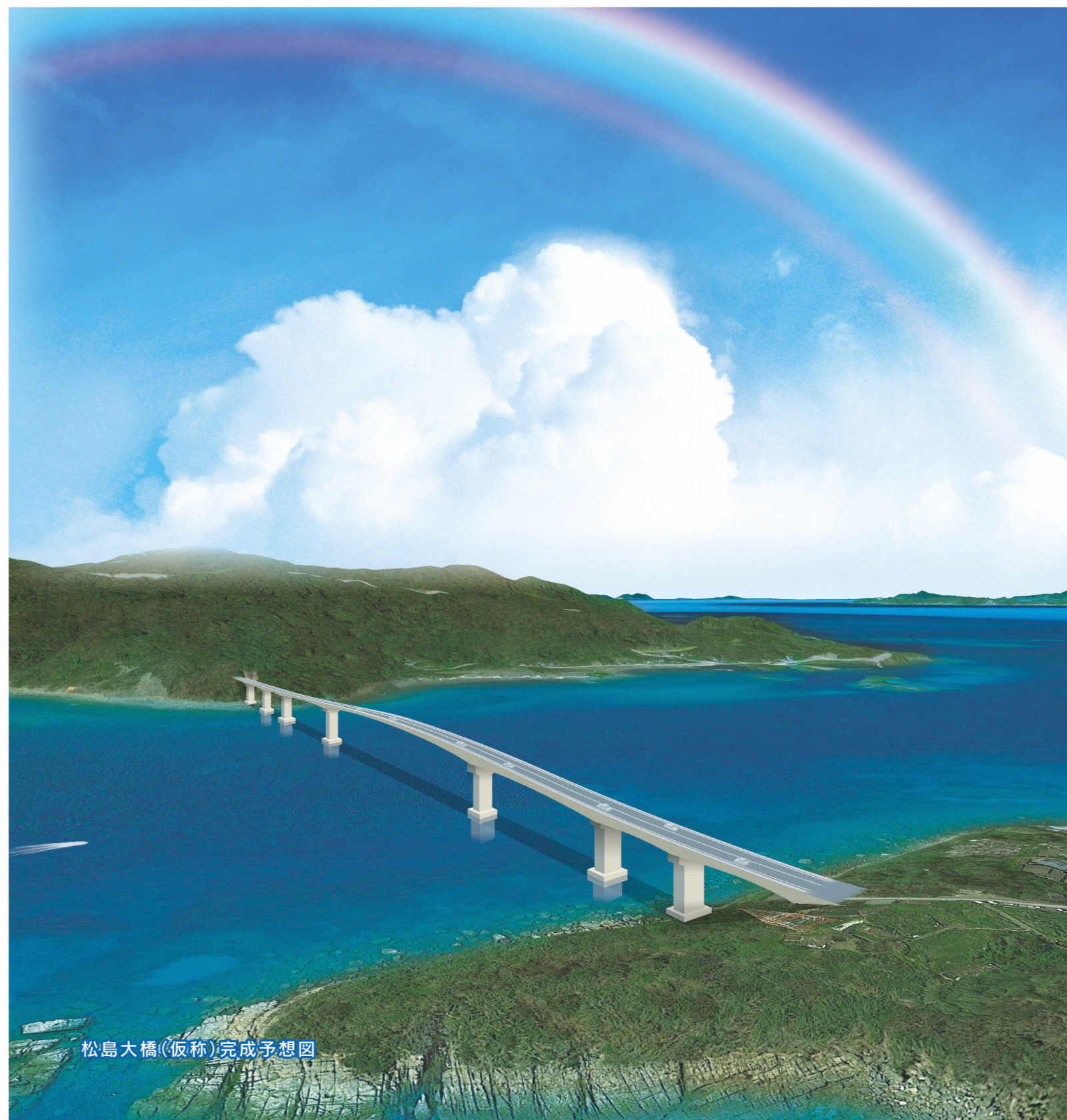
松島大橋(仮称)完成予想図