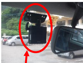
※フロント設置写真

車両内部から フロント（前方）のド ライブレコーダー設置状 況をわかるように撮る